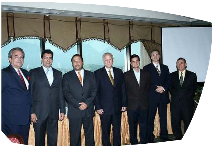
Junta Directiva APEX 2010